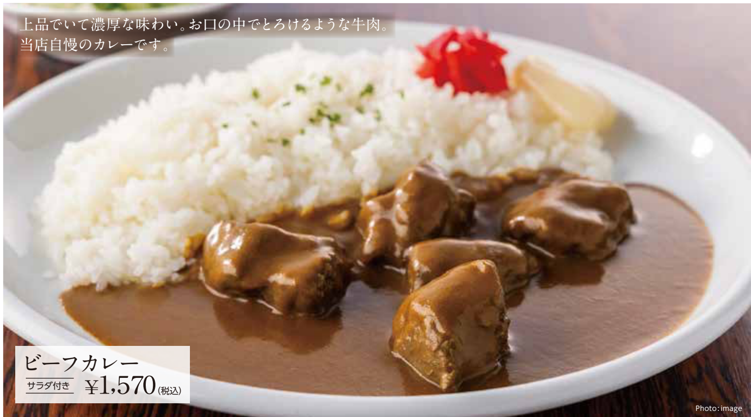
ビーフカレー サラダ付き ¥1,570 (税込)