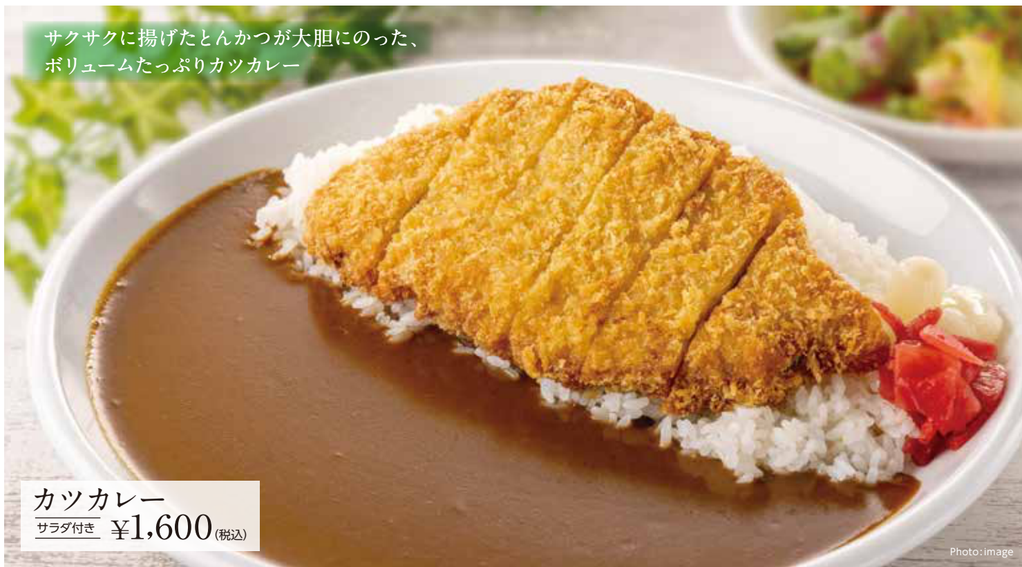
カツカレー サラダ付き ¥1,600 (税込)